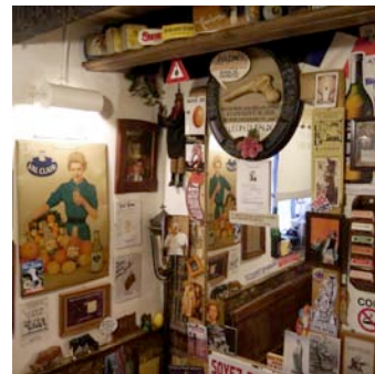
Chapelle de Libois – Jardin à Libois – Café « Le Moderne »