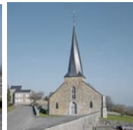
Centre culturel – Ferme de l'Aître – Eglise